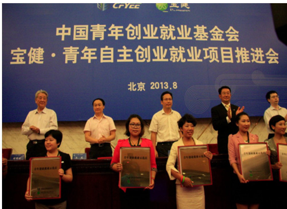
颁发“青年创业示范店”铭牌

18 名首批得到该项目扶持的青年获颁“青年创业示范店”铭牌，部分创业青年代表介绍了自己的创业经历和成长感悟。这为创业青年提供了相互交流和学习的机会。